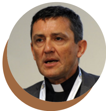
MONS. GIOVANNI CESARE PAGAZZI

Arcivescovo cattolico e teologo italiano, dal marzo 2025 Archivista e Bibliotecario di Santa Romana Chiesa. Nato a Crema l'8 giugno 1965, ordinato presbitero il 23 giugno 1990.