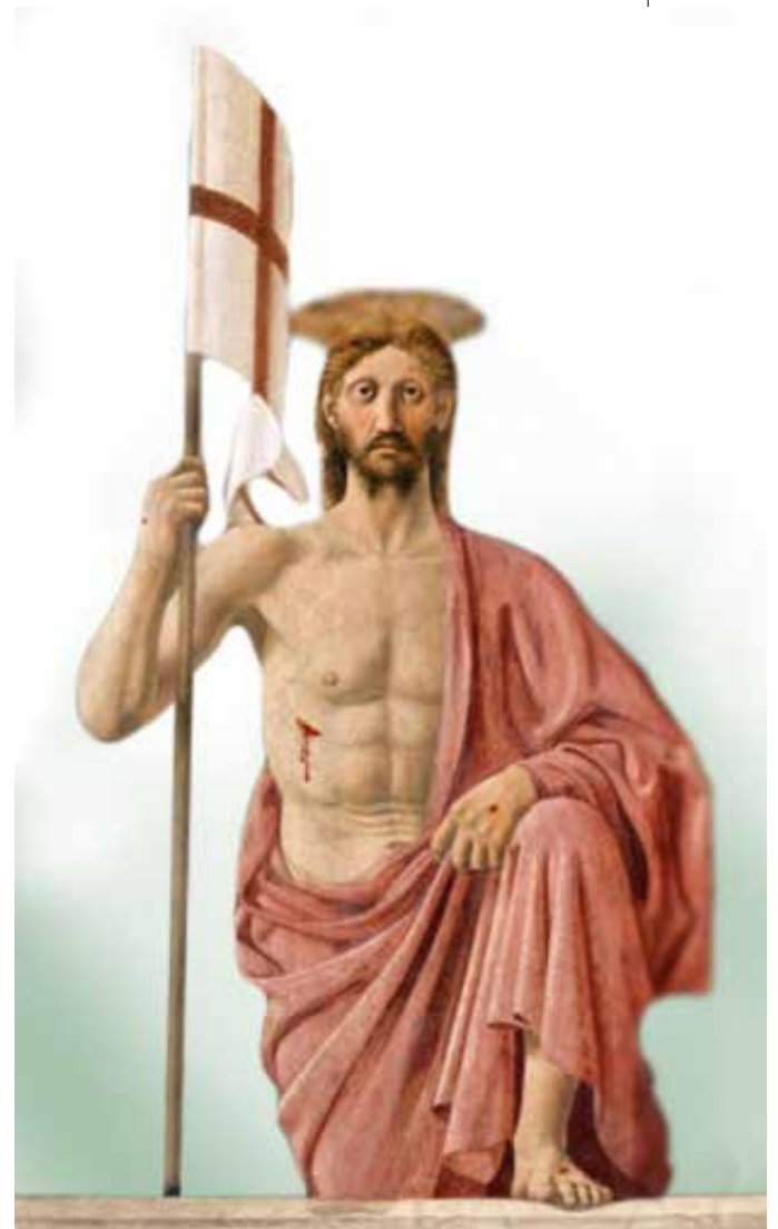
Resurrezione - Piero della Francesca

Al atardecer de aquel "primer día" Jesús entra en la casa donde están encerrados los discípulos, llenos de miedo y angustia. Se acerca a ellos y les dice: « ¡Paz a ustedes!» (Jn 20,19). Muestra los signos de la crucifixión y luego sopla su Espíritu, un soplo que reaviva la vida allí donde parecía extinguida toda esperanza, que borra la confusión, que entrega el sueño de una humanidad distinta,