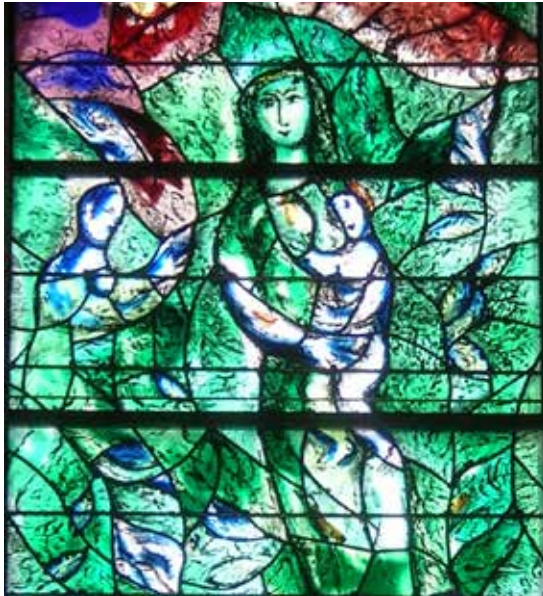
Verrata Mark Shagall

bilatérale) du testament qui est toujours unilatérale! Ce passage est décisif! Et pour le comprendre devient nécessaire l'aide de l'Apôtre des gens! Dans la Lettre aux Romains et dans la Lettre aux Galates, Paul insiste beaucoup sur l'alliance que Dieu a stipulée avec Abraham avant la circoncision, faisant jaillir de ce patriarche la justification