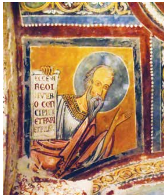
Cattedrale di Anagni Cripta: ISAlA

No fundo, estas palavras fazem-nos compreender que para trilhar o caminho certo, para finalmente começar a navegar no caminho do Senhor, é necessário antes de tudo sintonizar a própria mentalidade com o modo de pensar que é próprio de Deus. As boas intenções que surgem em nossas leituras orantes da Bíblia, aparecem em nossos comportamentos e atitudes, que são imediatamente visíveis e verificáveis, enquanto frequentemente nossas motivações profundas permanecem completamente esquecidas.