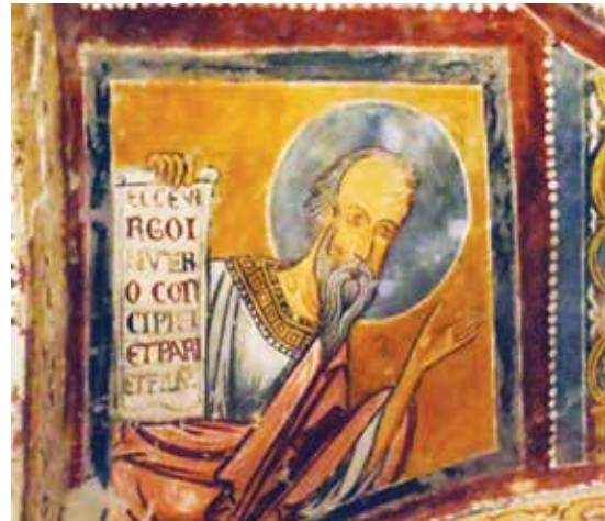
Cattedrale di Anagni Cripta: ISAIA

«...mes pensées ne sont pas vos pensées, vos voies ne sont pas mes voies... Ce que les cieux sont hauts par rapport à la terre, ainsi mes voies sont hautes par rapport à vos voies, ainsi mes pensées par rapport à vos pensées» (Is 55,8-9).