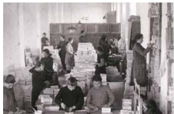
Taller de encuadernación - ALBA 1923