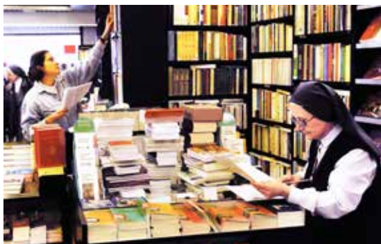
Centre «Paoline Multimedia»

En 2004 m'a été donnée l'opportunité d'approfondir, ensemble à des excellentes sœurs, le thème de la collaboration des laïcs