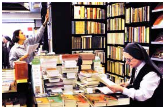
Centro Paoline Multimedia”

Em 2004 foi-me dada a possibilidade de aprofundar, juntamente com excelentes ir-