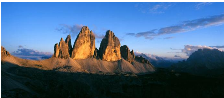
Les trois Cimes de Lavaredo sur les Alpes orientales

Salutations de la Rédaction de Paoline Online