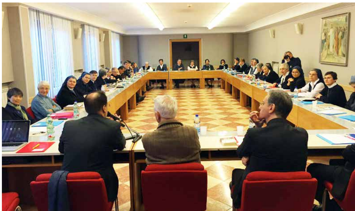
Ariccia (Roma), Casa Divino Mestre, 7-10 de janeiro de 2016