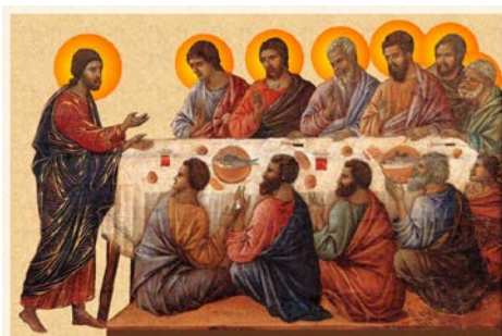
A LA TABLE DE LA PAROLE ET DE L'EUCCHARISTIE

Le texte sur la communauté paulinienne fera référence constante à la Parole : à la parole pour communiquer, entendue dans son acception plus ample, et à la Parole avec la P majuscule, qui nous «convoque» et nous «réunit» au nom du Seigneur, pour que nous puissions devenir «Parole vivante», signe communicant dans l'Eglise.