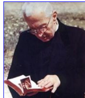
Bienheureux J. Alberione

Son dynamisme spirituel et la passion apostolique qui ne lui donnait pas de répit l'a conduit à susciter beaucoup d'énergies humaines et à tirer des moyens imposants presque de rien. Et à transmettre à ceux qui l'ont suivi le désir d' aller vers les nations, même les plus lointaines sans autre bagage que sa propre foi et le besoin ardent de la partager avec tous. Il a trouvé une foule de disciples, hommes et femmes, intrépides, généreux, surtout pleins de foi, comme Abraham qui va là où Dieu l'appelle, sans savoir ce qu'il rencontrera, mais ayant confiance en Lui. Ils portaient sans bagage et sans