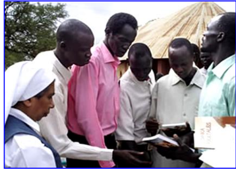
Soudan, Nouvelle Fondation 2008

spécial qui nous fait redevables de l'Évangile envers tous, est radicale. Elle nous demande, et non seulement le premier jour, mais constamment, de savoir partir, faisant confiance en sa promesse. Laisser un présent où nous nous sommes peut être situés, pour un futur qu'on arrive seulement à entrevoir. Accepter le changement, le nouveau qui vient de Dieu et qui parfois nous conduit à arracher les racines de notre existence, à quitter peut être sa propre terre, sa culture, ses affections, ses habitudes, une œuvre à laquelle on a dédié une partie importante de sa vie pour aller outre, avec une âme ouverte et le cœur toujours jeune . La jeunesse n'est pas une période de la vie. Nous pouvons avoir 70, 80 ans et conserver un esprit jeune, avec l'élan de