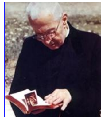
Beato Giacomo Alberione

Su dinamismo espiritual y su pasión apostólica que no le daban tregua, lo llevaron a suscitar tantas energías humanas y a tomar medios imponentes casi de la nada. A transmitir a los que lo seguían la urgencia de ir hacia las naciones, aún a las más lejanas, sin otro equipaje que la propia fe y la necesidad vehemente de compartir con todos. Ha encontrado una escuadra de seguidores, hombres y mujeres intrépidos, generosos y sobre todo llenos de fe, como Abrán que va a donde Dios lo llama, sin saber qué encontrará, pero fiándose de Él. Partían sin equipaje y sin dinero, con pocas cosas; a menudo sin ni siquiera tener una dirección a la cual dirigirse, fiándose únicamente de Dios, que piensa en los pájaros y en los lirios del