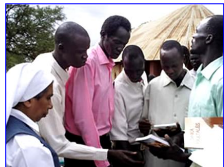
Sudán nueva Fundación 2008