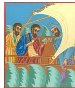
São Paulo viaja a Roma – Ícone de T. Groselj, fsp