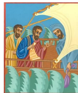
Saint Paul voyage à Rome Icône de T. Grosej, fsp

Après un séjour de trois mois, ils reprennent le voyage vers l'Italie, passant par Syracuse, Reggio de Calabre, Pouzzoles jusqu'à quand ils arrivent à Rome, sur la Via Appia.