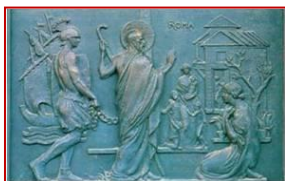
Saint Paul arrive à Rome

Aire Collaborateurs – Paul arrive a Rome comme prisonnier du Christ (cf Actes 21,15-28,30) (17-02-2009)